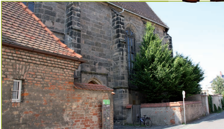
Das Kloster Heilig Grab