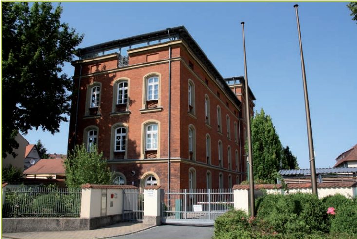
Das ehemalige Lazarett der Armee heute.

Du stehst nun vor dem ehemaligen Lazarett der Armee. Lazarett ist ein anderes Wort für Krankenhaus . Heute befindet sich hier die Landesjustizkasse. Dieses Backsteingebäude ist neben dem Bahnhof ein Beispiel für die Umnutzung des Gärtnergebietes. Vor 200 Jahren war das Gärtnerland noch viel größer. Aber durch Bauten wie den Schlachthof, Armeengebäude und mehrstöckige Wohnhäuser schrumpfte das Gebiet immer weiter zusammen. Auch wollten viele Kinder von Gärtnern den Betrieb der Eltern nicht weiterführen. So kommt es, dass von einst über 500 Betrieben heute nur noch rund 20 übrig sind.