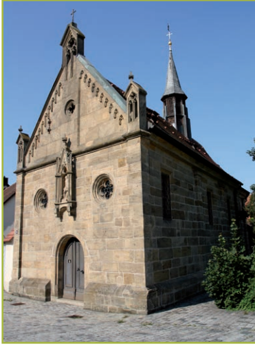
Die Sebastianikapelle in der Siechenstraße

Die Statue, vor der du nun stehst, zeigt den Heiligen Sebastian .